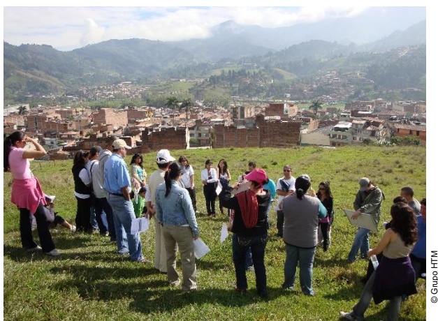
Trabajo de conceptos: ecología urbana e interrelaciones en el territorio