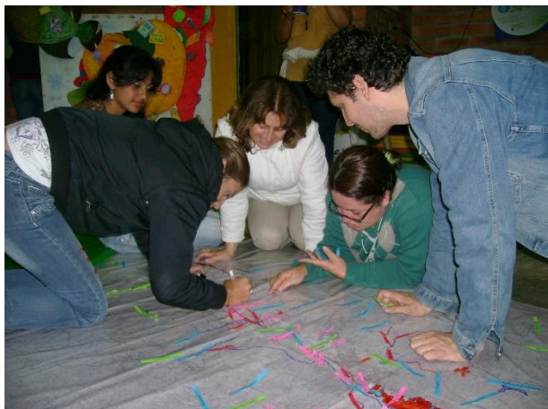
Talleres de aproximación a los contenidos del programa

Al final de la fase de convocatorias hubo un balance promedio de 37 participantes por actividad y quedó conformado el grupo de investigadores del hábitat local con un total de 32 personas.