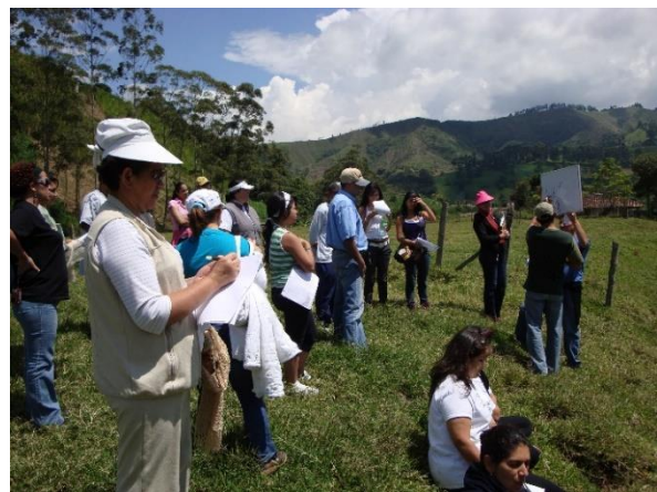
Lectura y percepción de paisajes e imágenes territoriales